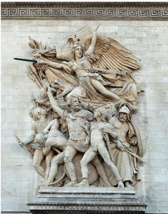
Le départ des volontaires de 1792, aussi appelé La Marseillaise de François Rude.

Le dessin que vous voyez sur le diplôme est une reproduction de la sculpture de François Rude qui se trouve sur l'Arc de triomphe à Paris.