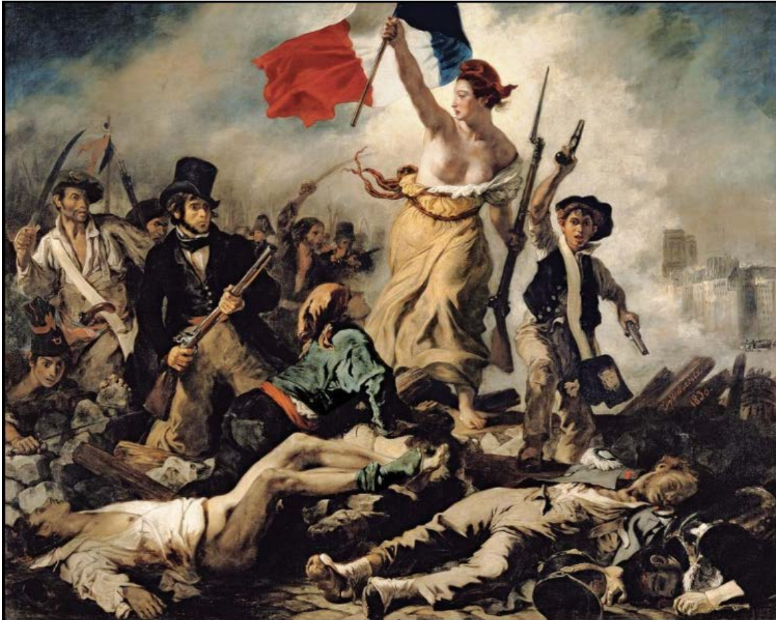
Eugène Delacroix, La Liberté guidant le peuple , 1830, huile sur toile, 260x325 cm, collection du Musée du Louvre.

La toile est en ligne sur le site de L'Histoire par l'image :