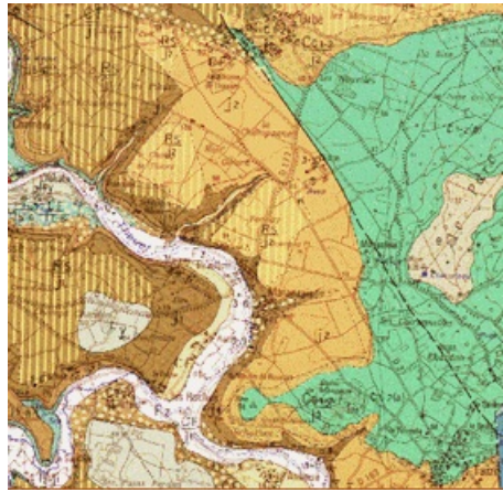
Extrait de la carte géologique de Thouars au 1/50000 (n°539), BRGM