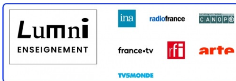
Lumni : les ressources

Lumni est une plateforme qui regroupe des milliers de sons et de vidéos issus de France TV, l'INA, Arte... Des ressources consultables en ligne , mais aussi souvent téléchargeables . C'est donc pour l'enseignant et ses élèves une mine de documents gratuits et respectueux des droits d'auteur .