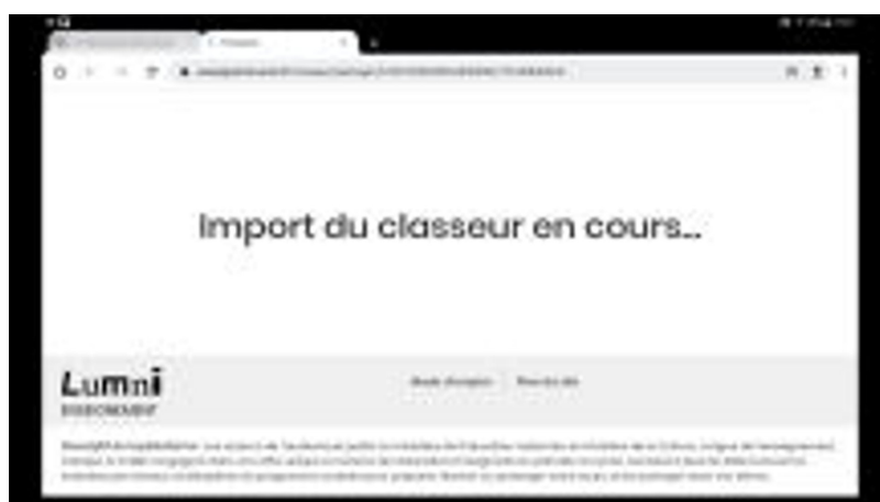
Tuto Lumni 2 - Partager une ressource Lumni sur tablette élève en passant par le Mediacentre (Vidéo PeerTube)

Tutoriel vidéo de l'utilisation par QR Code :