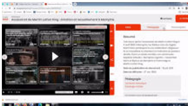
Tuto Lumni 1 - Utiliser Lumni par le Mediacentre de l'ENT I-Cart (Vidéo PeerTube)

Lumni enseignement est une plateforme avec des milliers de ressources audio et vidéo gratuites et libres, proposées notamment par France Télévisions, Arte, l'INA... Elles sont accessibles depuis Eduthèque mais aussi depuis le Mediacentre de l'ENT : une solution plus efficace pour partager des documents avec les élèves.