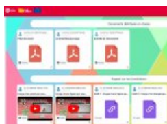
Partage de ressources sur le mur virtuel "Magneto" de l'ENT Lycée connecté

Exemples vécus, outils mis à disposition dans l'académie.