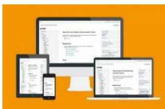
Moodle s'adapte à tous les appareils.

Quand l'élève fait des exercices sur une plateforme telle que Labomep 3 , les traces de son parcours sur l'outil fournissent aux accompagnateurs des informations sur les points à reprendre. L'enseignant.e peut alors reprendre certaines explications, ou diriger vers l'élève des exercices adaptés à son cas. Le professeur s'appuie sur des exercices déjà créés et compose le "menu" de l'élève.