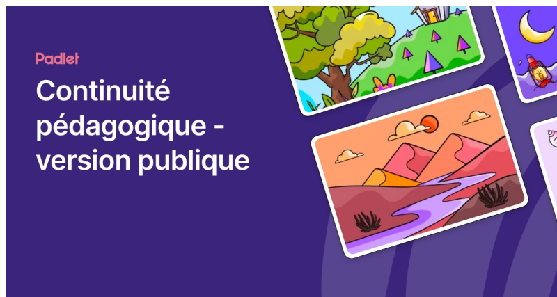
Continuité pédagogique - version publique (Padlet) Espace PROF - collège Louise Michel 86320