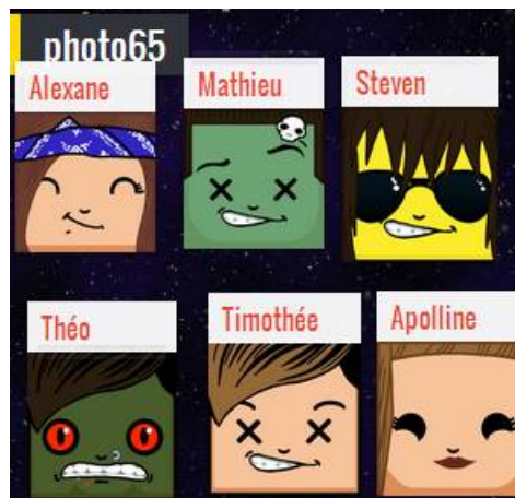
Exemple de mur collaboratif sur l'identité numérique

Padlet apporte une solution agréable à utiliser pour faire créer en groupe un document commun multimédia (intégrant si nécessaire des images fixes ou animées, des fichiers audio...). Certains enseignants créent un mur virtuel sur lequel les élèves peuvent ajouter leurs "post-it" sans pouvoir modifier le contenu déjà affiché, et intègrent dans ce document des liens vers d'autres "murs pour élèves" gérés avec un paramétrage différents. Ces "murs pour élèves" peuvent être plus collaboratifs (interactions possibles sur les post-it, le professeur ou un élève pouvant être modérateur des posts pour le groupe), et ne nécessitent pas la création d'un compte pour les contributeurs.