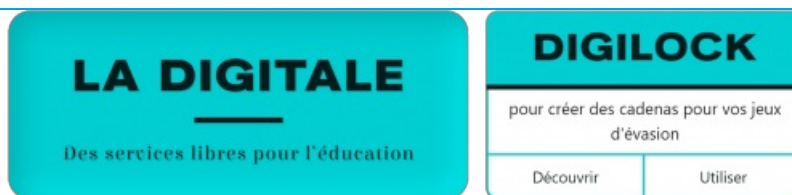
DIGILOCK de LaDigitale