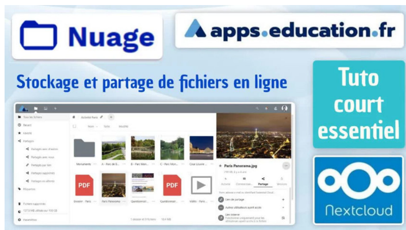
Tuto - NUAGE des Apps.education.fr (court) (stockage et partage en ligne, appli EN) (Vidéo PeerTube)

NUAGE est une application de la plateforme Apps.education.fr de l'Education Nationale française. C'est un espace de stockage (100 Go) et de partage de fichiers en ligne compatible RGPD qui utilise le logiciel libre Nextcloud. Un autre tuto plus complet est disponible sur ma chaîne. Chapitres : 0:00 Présentation & connexion ("instance" = votre région académique) 1:32 Création, importation, gestion des fichiers et dossiers dans Nuage 3:49 Partager un fichier ou un dossier 6:48 Suite bureautique en ligne Collabora : ouvrir, modifier, partager collaborer en ligne 8:33 Importer un doc (Libre Office, Microsoft Office...) pour les modifier dans Collabora 10:22 Installer le client Nextcloud pour synchroniser un dossier local avec Nuage en ligne 14:18 Installer le client Nextcloud sur un appareil mobile (tablette / smartphone) https://apps.education.fr/ Tuto NUAGE complet & chapitré : https://youtu.be/Jq_Si7gG98Y