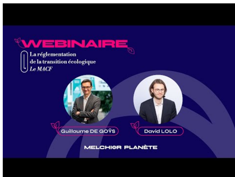
Le MACF - Décryptage de la réglementation de la transition écologique (Video Youtube)

Où en est réellement la décarbonation de l'industrie ? Quels sont les grands principes du marché carbone ? Quels sont les objectifs, les conséquences et les failles du MACF ? D'autres leviers de compétitivité industrielle existent-ils ?