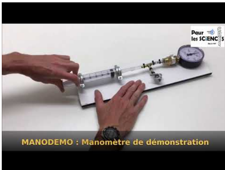
MANODEMO (Video Youtube)

Ce manomètre analogique permet la lecture aisée sur un cadran de Ø 80mm, de la pression lors d'une détente ou lors d'une compression grâce à son affichage -1 bar à 1.5 bar .