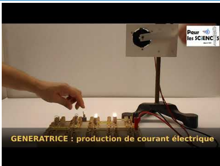
GENERATRICE (Video Youtube)