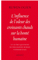
L'influence de l'odeur des croissants R. OGIEN La vie des idées