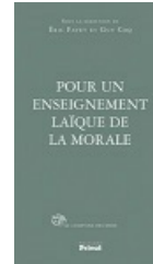
Pour un enseignement laïque de la morale E. FAVEY - G. COQ La ligue de l'enseignement - Les Cahiers Pédagogiques