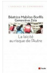
La laïcité au risque de l'Autre B.M-BONFILS-G. ZOÏA La vie des idées