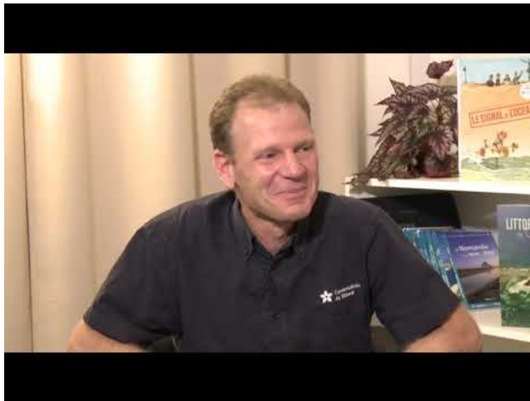
Littoraux et changement climatique (Video Youtube)