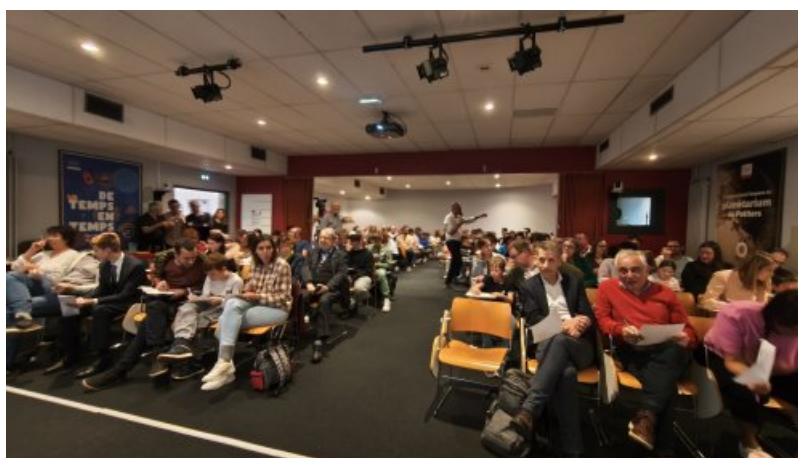
Un public venu en nombre pour la cérémonie de remise des prix

Une centaine de personnes avait fait le déplacement afin d'assister à cet événement convivial. De nombreux lauréats (du CE1 à la Terminale) étaient présents ainsi que leurs parents, leurs professeurs ou leurs chefs d'établissement.