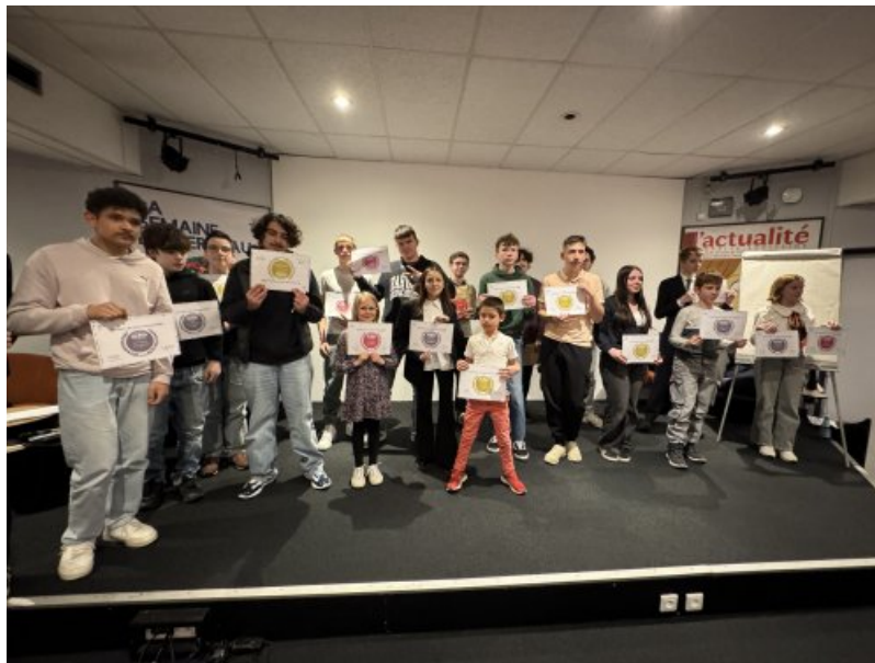
Photo de groupe des lauréats

Cette cérémonie a aussi permis de récompenser les trois lauréats du concours académique de programmation Codémoi .