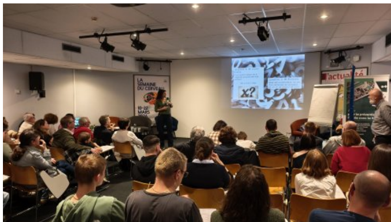
Concours de calcul mental grand public