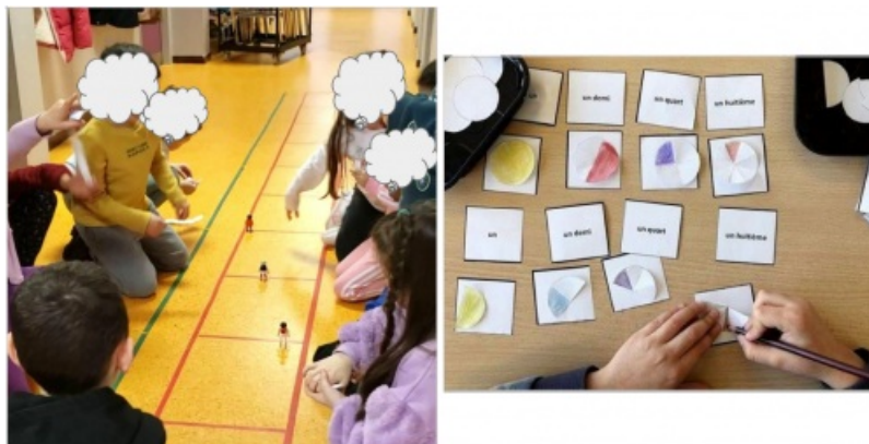
Découverte de la fraction un huitième et partage de différentes figures

Une attention particulière sera donnée aux fractions d'une longueur donnée afin de faciliter le passage aux positionnements des fractions sur la droite graduée.