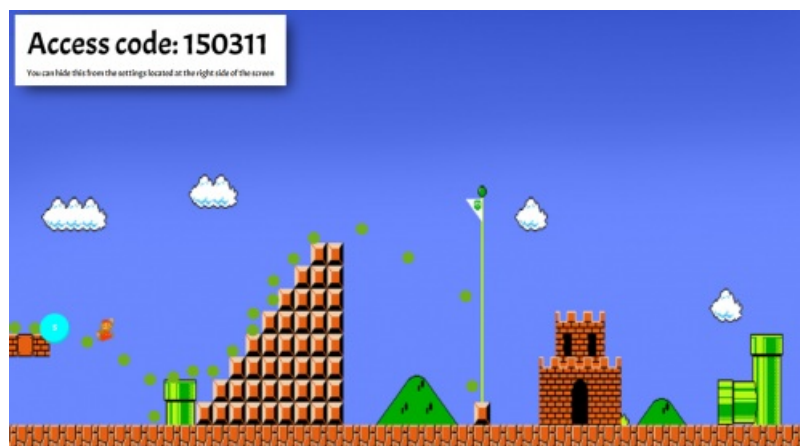
Décor du jeu

Quiznetic est une application gratuite qui permet de réaliser des quiz. Chaque joueur est représenté par un pion sur un plateau de jeu virtuel projeté au tableau. Les pions avancent en fonction des réponses fournies. Il y a donc un challenge entre les joueurs, qui répondent aux questions à leur rythme.