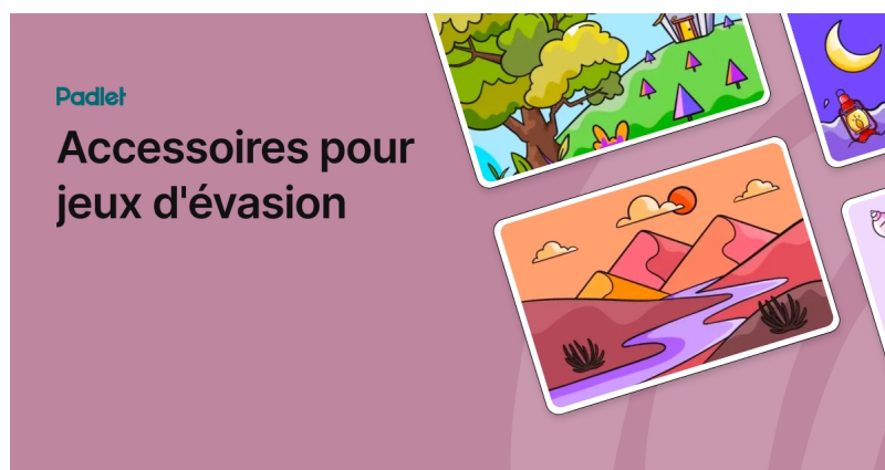
Accessoires pour jeux d'évasion (Padlet)

Un padlet réalisé par Christelle Quesne (site Escape n'games ) regroupe de nombreuses idées de matériels utiles pour concevoir un escape game :