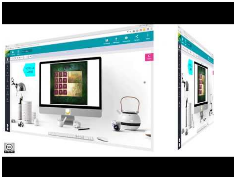
Tuto Genially - Créer et améliorer un mot de passe / code (Video Youtube) auteure : Mélanie Fenaert, enseignante de SVT dans l'académie de Versailles

Un tutoriel en vidéo réalisé par Mélanie Fenaert , enseignante de SVT dans l'académie de Versailles