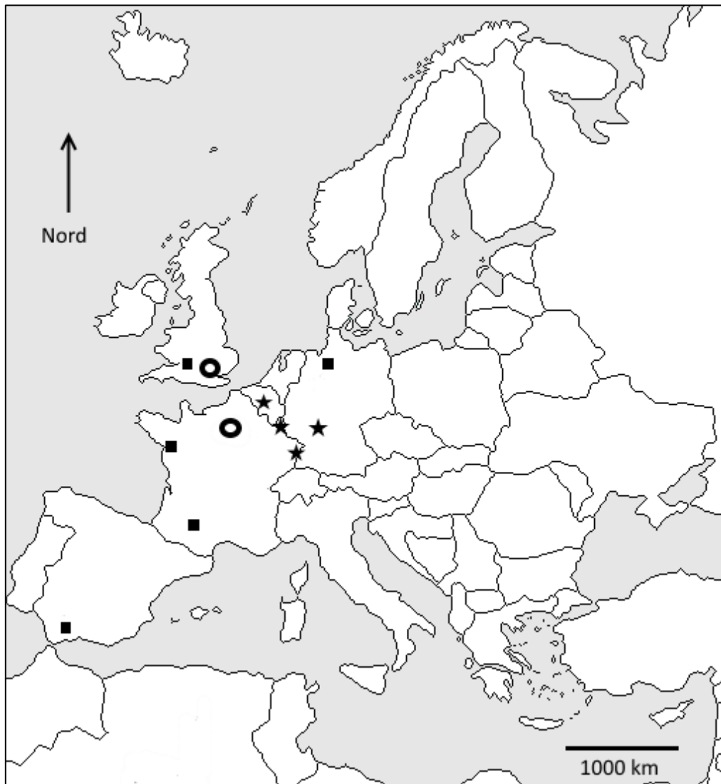
L'Union européenne et ses territoires au 1 er janvier 2018