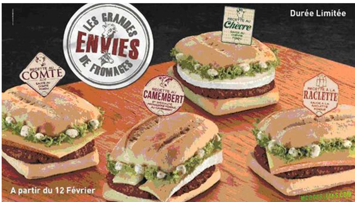
Opération promotionnelle McDonald's "Les grandes envies de fromages" (février 2013)