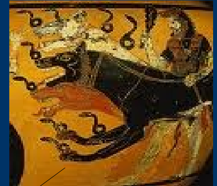
Les gardiens Le chien Cerbère Les Érinyes