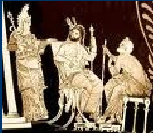
Les 3 Juges : Minos , Éaque, Rhadamanthe