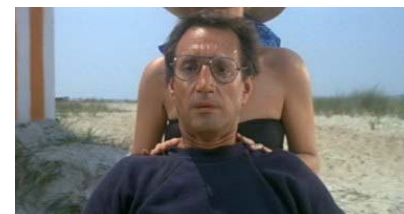
Effet « vertigo » dans Jaws de Spielberg

Et après ? Avant d'assister à une projection du festival, les enseignants peuvent voir un court métrage en classe et préparer avec leurs élèves les questions qui seront posées au réalisateur. Après la projection et la rencontre, des outils pédagogiques remis aux enseignants permettent un travail approfondi en classe. Une formation pour initier des ateliers simples est également proposée aux enseignants (Cinéma bricolé - au Tap le 14 novembre).