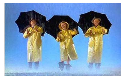
Du muet au parlant : Singin' in the Rain