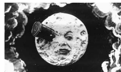
Premiers effets spéciaux chez Méliès

L'atelier est réservé aux classes de collèges et lycées qui s'engagent à participer à au moins une projection du Poitiers Film Festival. Les dates d'intervention sont à fixer en concertation avec les établissements. Une participation forfaitaire est demandée.