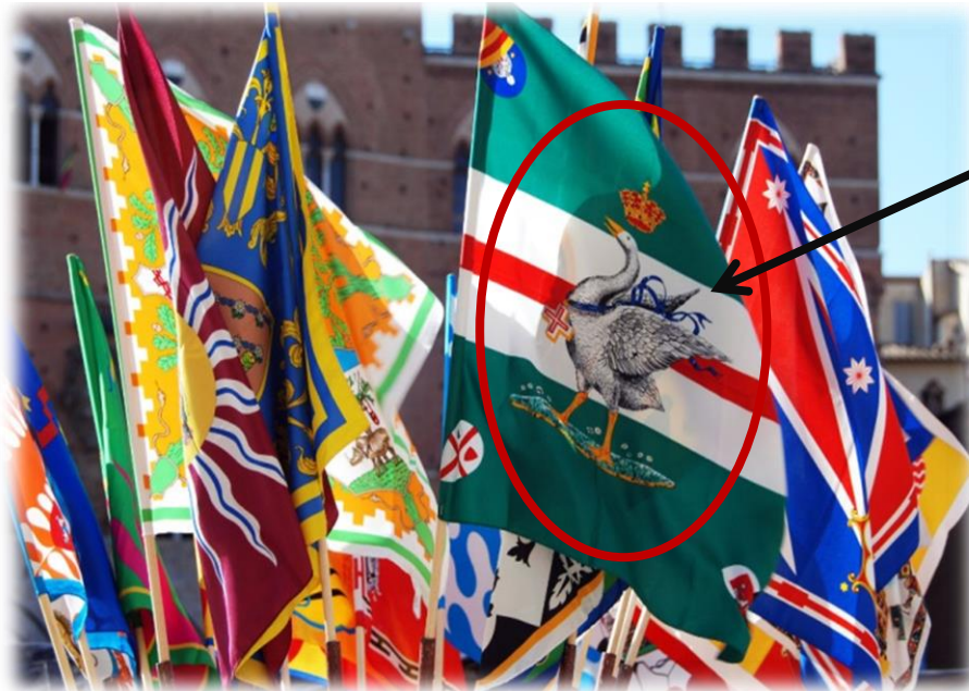
La bandiera (le drapeau) della contrada dell'Oca (l'Oie)