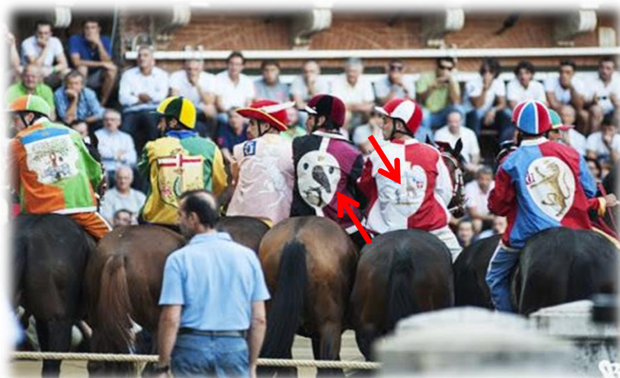
Le uniformi dei fantini con i simboli delle contrade corrispondenti → la civetta (la chouette) a sinistra; → la giraffa (la girafe) a destra