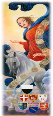
Palio edizione 2019