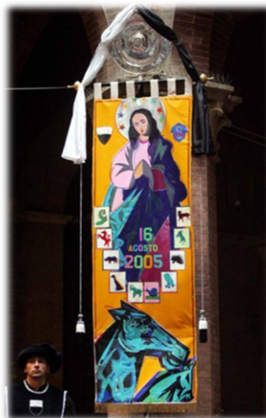
Palio edizione 2005