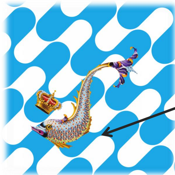
La bandiera della contrada dell'Onda (l'Onde) → il cui simbolo è un delfino