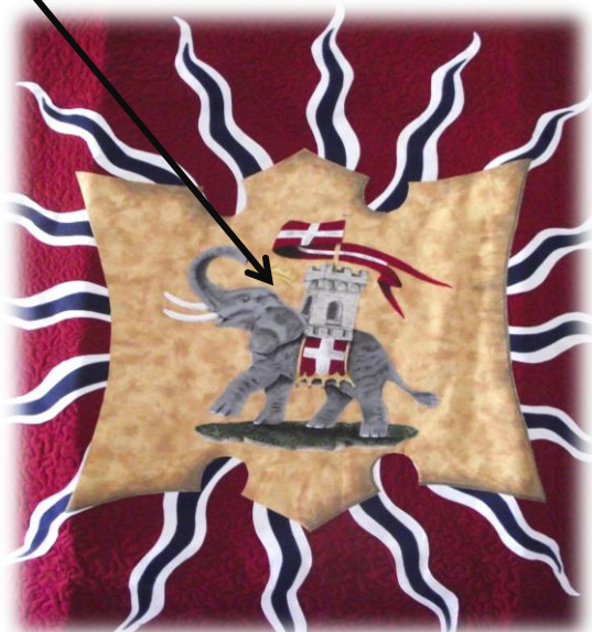
La bandiera della contrada della Torre (la Tour) → il cui simbolo è un elefante