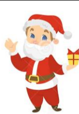
il Babbo Natale