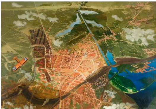
Impression de Lens