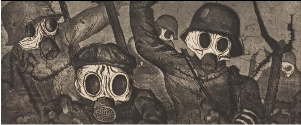
Assaut sous les gaz, 1924

Il peindra aussi les conséquences de la guerre : les estropiés dans les joueurs de Skat et la misère des combattants à leur retour dans Le marchand d'allumettes ou la rue de Prague .