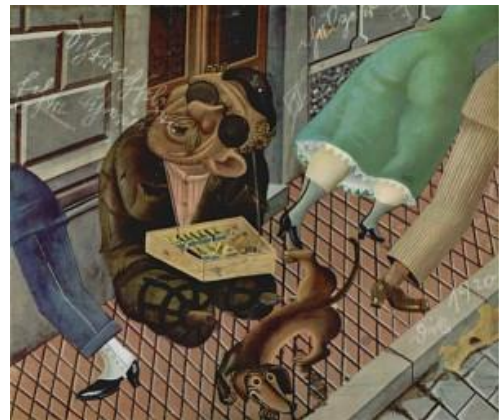
Le marchand d'allumettes, 1920