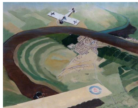
bataille aérienne au-dessus de KUT El Amara, 1915