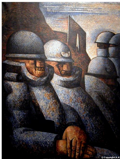
Marcel Gromaire, La Guerre , huile sur toile, 127x97,8 cm, musée d'art moderne de la ville de Paris.