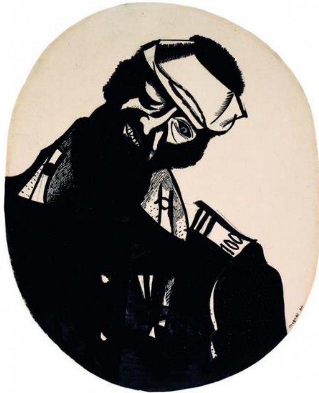
Le soldat blessé 1914, encre de Chine sur papier

Il est mobilisé en 1915. Il ne combat pas au front mais rend compte des ravages de la guerre dans une série de dessins.