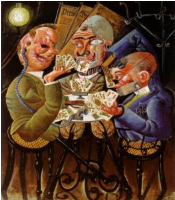
Les joueurs de Skat, 1920

Il peindra aussi les conséquences de la guerre : les estropiés dans les joueurs de Skat et la misère des combattants à leur retour dans Le marchand d'allumettes ou la rue de Prague .