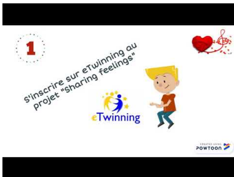
Sharing feelings 2019-2020 (Video Youtube)