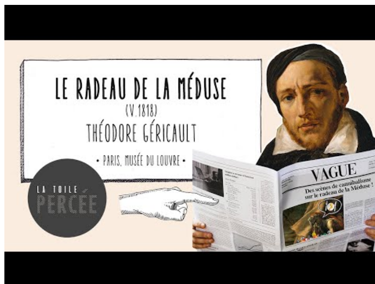
La Toile Percée - Le Radeau de la Méduse, Géricault (Video Youtube)