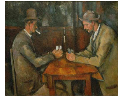
Paul Cézanne. Les joueurs de cartes. 1893-1896. huile sur toile. 47 x 56 cm

L'amitié qui lie le peintre incompris et le romancier s'apparente à celle qui lie Paul Cézanne à Emile Zola, depuis leur enfance à Aix-en Provence