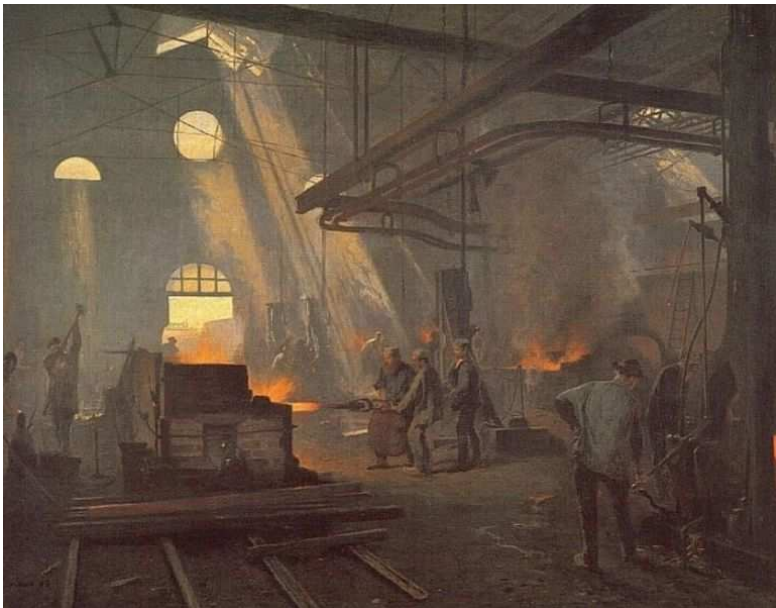
Fernand Cormon (1845-1924) Une forge - 1893 Huile sur toile H. 72 ; L. 90 cm - Paris, Musée d'Orsay

Les éléments en fonte des Halles sont coulés dans la fonderie de Mazières, près de Bourges, ainsi que dans les établissements Muel, What et Cie dans la Meuse, avant d'être acheminés à Paris. Comment sont-ils acheminés ?