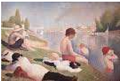
Cartel de l'exemple : Georges Seurat (1859-1891) Une Baignade à Asnières .1884. Huile sur toile. 201 x 300 cm. National Gallery. Londres.

En 1959, les Halles furent transférées à Rungis, au sud de Paris.