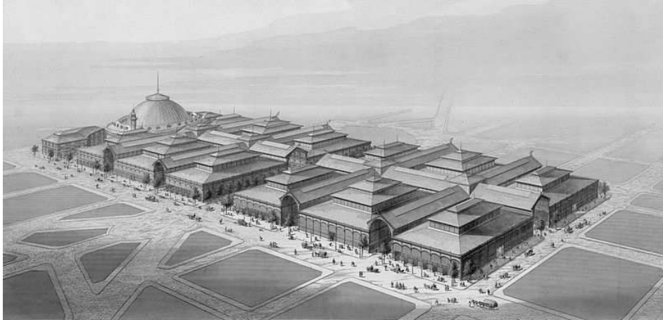
Dessin vu d'oiseau des Halles centrales de Paris

Victor Baltard (1805-1874) a fréquenté les cursus d'architecture et de peinture de l'École des Beaux-arts. Son parcours d'architecte a été couronné par le Prix de Rome.