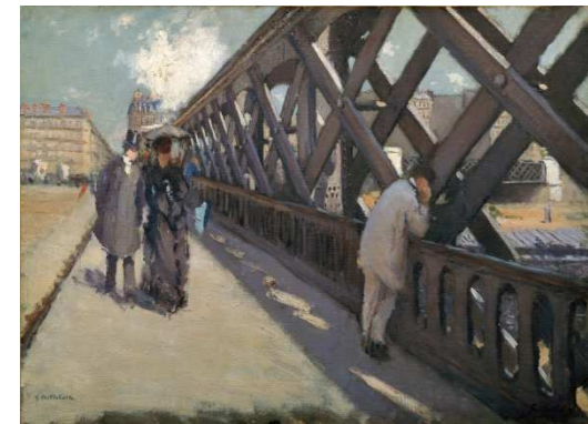
Caillebotte G. Le pont de l'Europe .1876. huile sur toile. 125 x 181 cm . Musée Petit Palais. Genève