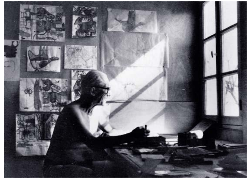
Le Corbusier au travail, dans son cabanon et dans son atelier