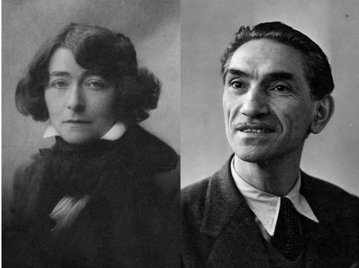
Eileen Gray et Jean Badovici vers 1930