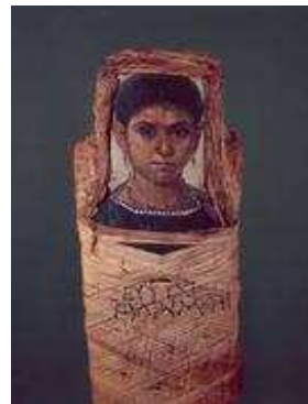
Portraits sur bois de cèdre peint à l'encaustique et doré.