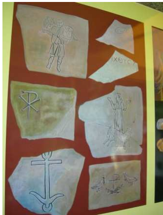
Symboles figurant dans les catacombes de San Callisto- Rome

Comme tous les hommes de l'antiquité, les chrétiens aimaient beaucoup le symbolisme. Les symboles rappelaient leur foi de façon visible; le terme " symbole " indique un signe concret ou une figure qui, dans l'intention de l'auteur, rappelle une idée ou une réalité spirituelle.