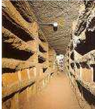
Catacombes de San Callisto à Rome

Depuis la plus haute antiquité, les cimetières se trouvent détachés de la ville des vivants ( polis/necropolis ). Pour une question d'espace à Rome, on creuse le long de la Via Appia dans le tuf, d'étroites galeries souterraines, sur plusieurs étages : les catacombes. Dans les parois des murs on creuse des espaces ou oculi , qui vont abriter les sarcophages ou les défunts enveloppés dans de simples linceuls . On s'éclaire à la lampe à huile *