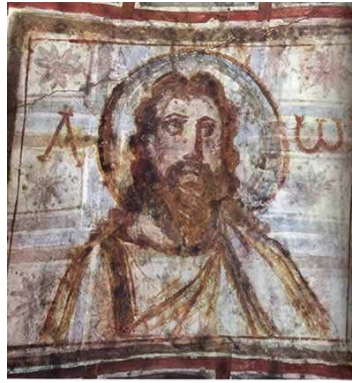
Fresque représentant Jésus entre l'Alpha et l'Oméga. Catacombes de Commodille.

La fresque est une technique particulière de peinture qui s'opère sur un enduit frais ou « a fresco ». Le fait de peindre sur un enduit qui n'a pas encore séché permet aux pigments (couleurs naturelles) de pénétrer dans la masse, et donc aux couleurs de durer plus longtemps qu'une simple peinture en surface sur un substrat. Son exécution nécessite une grande habileté, et se fait très rapidement, entre la pose de l'enduit et son séchage complet.