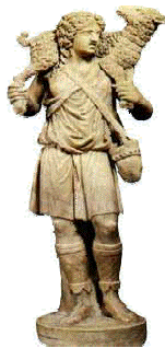
Sculpture du bon Pasteur

Le bon pasteur portant la brebis sur ses épaules représente le Christ sauveur et l'âme qu'il a sauvé. Ce symbole est fréquemment présent dans les fresques, dans les sculptures des sarcophages, dans les statues et on le trouve également souvent gravé sur les tombes.