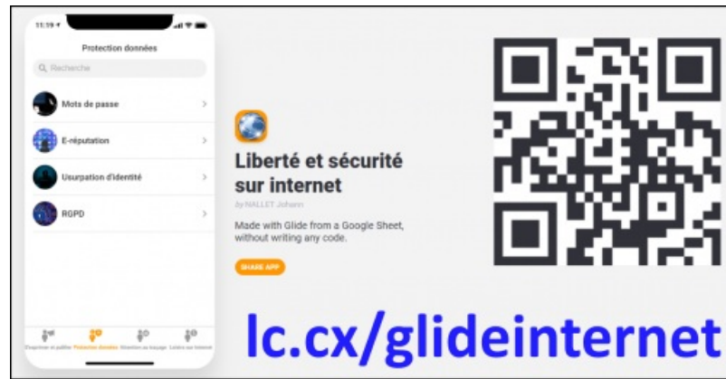
Glide EMC - Lien et QR Code exemple d'une application Glide

les tutoriels complets en fin d'article . ci-dessous un exemple de ce que cela peut donner (lien & QR Code vers l'application) :