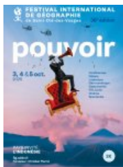
Affiche du FIG 2025

Lors d'une intervention remarquable au Festival International de Géographie de Saint-Dié-des-Vosges, Camille Escudé a partagé son expertise sur l'Arctique en mettant en lumière les dynamiques de pouvoir propres à cette région stratégique.