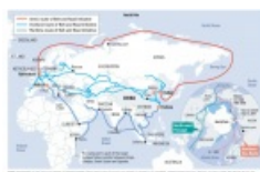
routes de la soie

Autre exemple, la carte de 2019 éditée par la Chine montrant le passage de la route de la soie par l'Arctique alors que celle-ci n'existe pas encore :