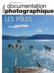
Documentation photographique "Les Pôles"

l'interface des relations internationales et de la géographie, elle s'intéresse à la coopération politique et à l'intégration régionale en Arctique.