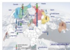
Flotte Brise Glaces

La carte sur la flotte mondiale de brise glace d'Hervé Baudu illustre bien le fait que l'Arctique est un territoire de démonstration de puissances.