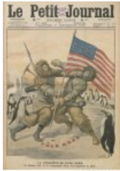
Petit Journal Arctique

L'Arctique peut être perçue comme la dernière frontière, le dernier front pionnier.