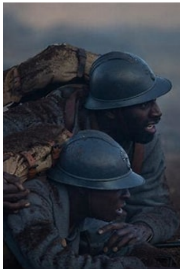
Affiche du film Tirailleurs

Ce long-métrage de Mathieu Vadepied, consacré aux tirailleurs sénégalais pendant la Première Guerre mondiale, était en sélection officielle au Festival de Cannes. Il sortira au cinéma le 4 janvier 2023.