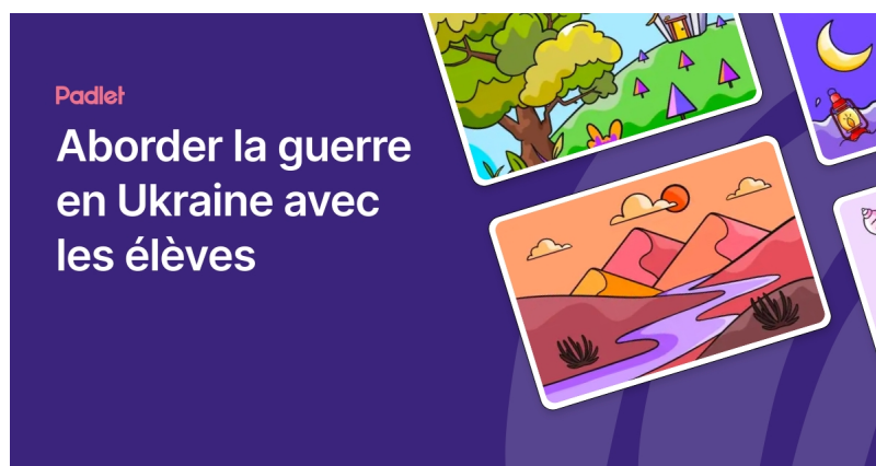
Aborder la guerre en Ukraine avec les élèves (Padlet)

Un mur de ressources ouvert pour les enseignants d'HG-HGGSP de l'OSUI