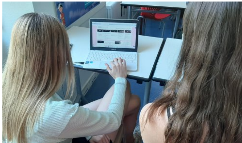
Découverte de la séquence -