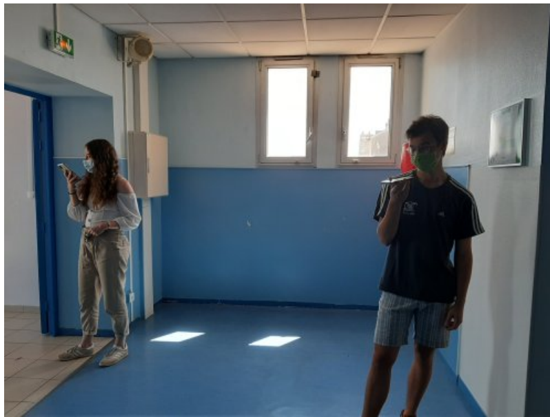
Enregistrement des audios

La suite : distanciel asynchrone : visiter le musée virtuel