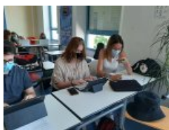
Confrontation des audios