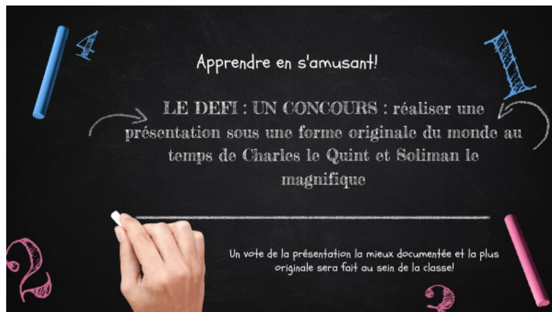
defi 5e Charles quint copie by College Maurice Genevoix on Genially (Genially)

En ces temps de confinement et de cours à distance, il est important de relancer constamment la motivation chez nos élèves. Voici le défi lancé pendant les vacances à mes élèves de 5ème.