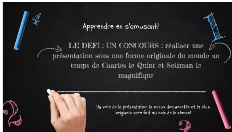
defi 5e Charles quint copie by College Maurice Genevoix on Genially (Genially)

En ces temps de confinement et de cours à distance, il est important de relancer constamment la motivation chez nos élèves. Voici le défi lancé pendant les vacances à mes élèves de 5ème.