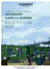
Affiche archives départementales de la Charente

" Été 1914, la Charente, accaparée par les travaux agricoles prend brutalement connaissance, de l'ordre de mobilisation générale, annonciateur d'une guerre totale. La politique culturelle et éducative des Archives départementales de la Charente s'attache à innover et à susciter la curiosité afin de favoriser la transmission de la connaissance et entretenir notre mémoire collective. Le parti-pris du docu-fiction Un enfant dans la guerre tient en quelques mots : transmettre l'Histoire en racontant une histoire. Le