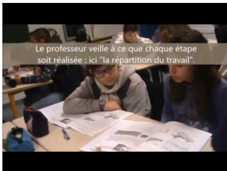
Déroulement de la séquence ( Video Youtube )

Vidéo présentant le déroulement de la séquence et montrant comment accompagner le travail des groupes :