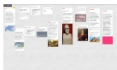
Copie d'écran Padlet.