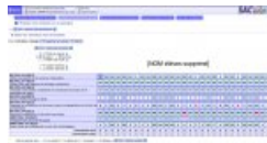
Compétences évaluées avec Sacoche