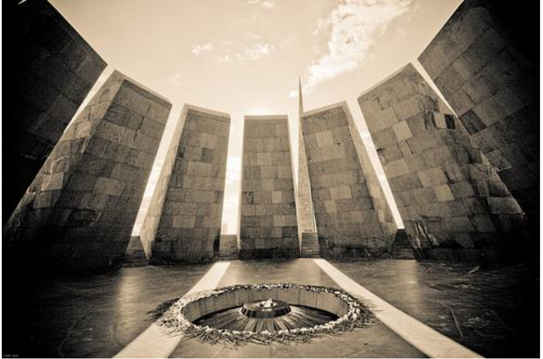
Dzidzernagapert (Colline des Hirondelles) Mémorial du génocide (Erevan, Arménie, inauguré en 1968)