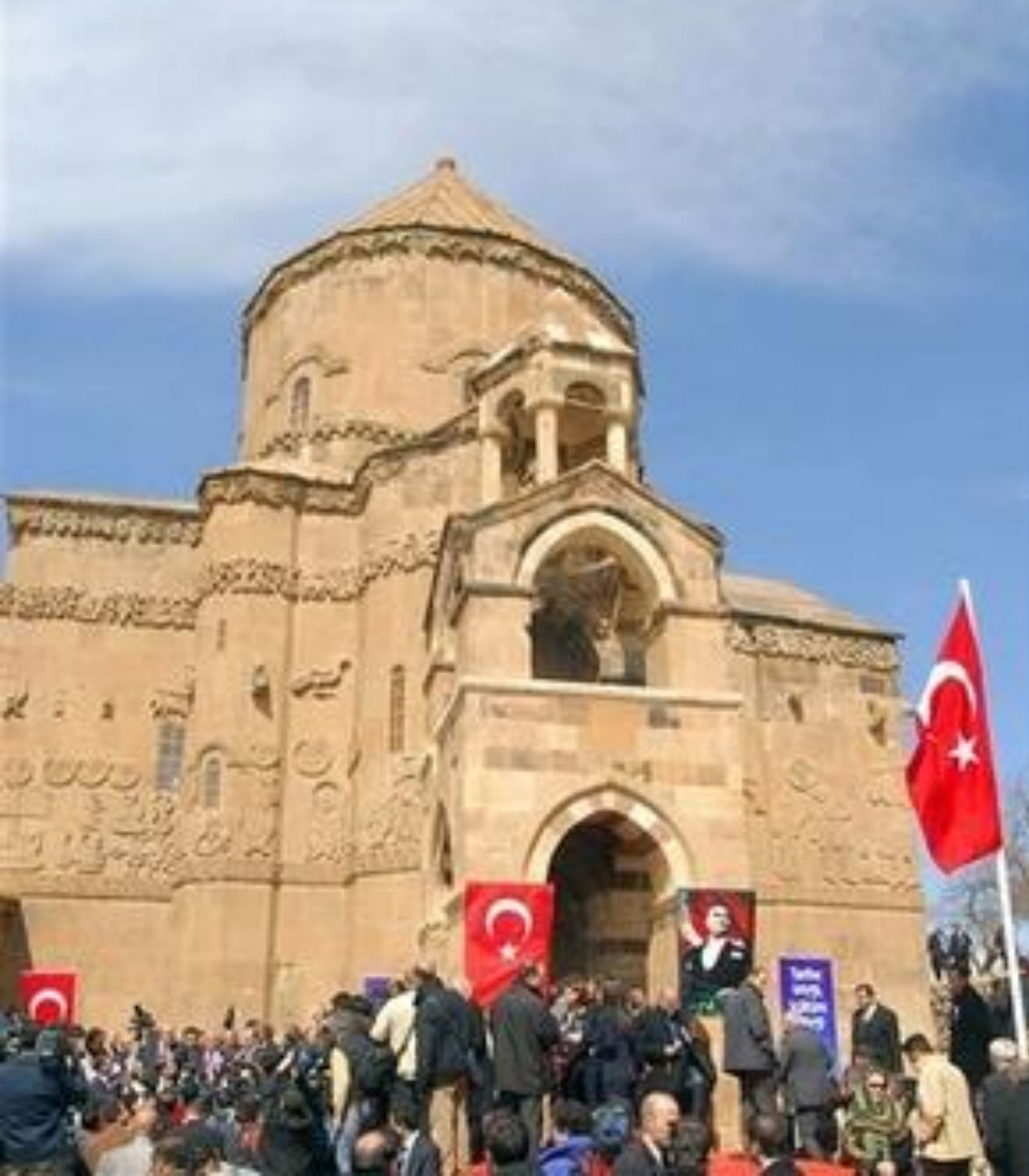
Réouverture de l'église d'Akhtamar (Turquie, 2007)