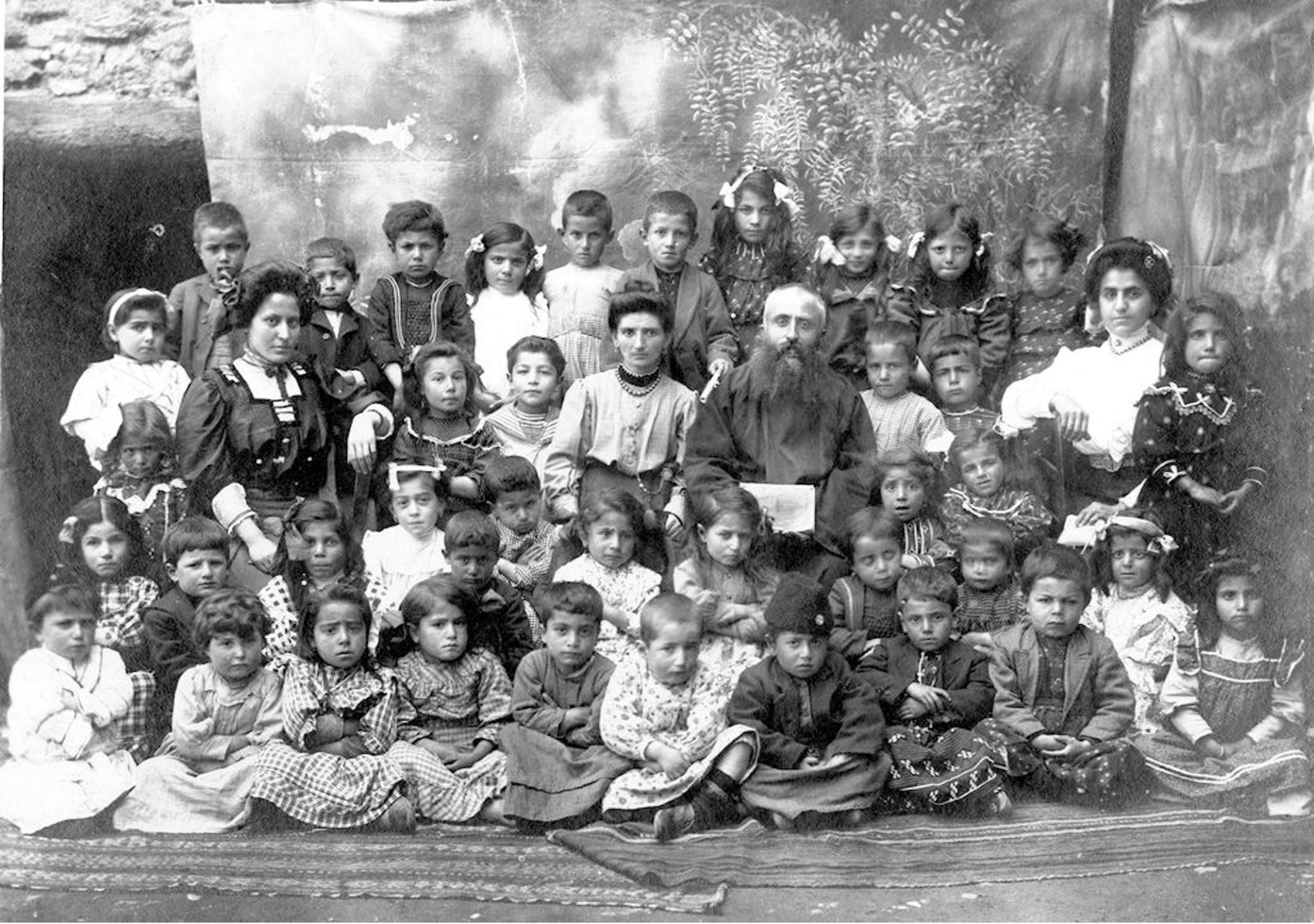
Bibliothèque Nubar de l'UGAB, Paris