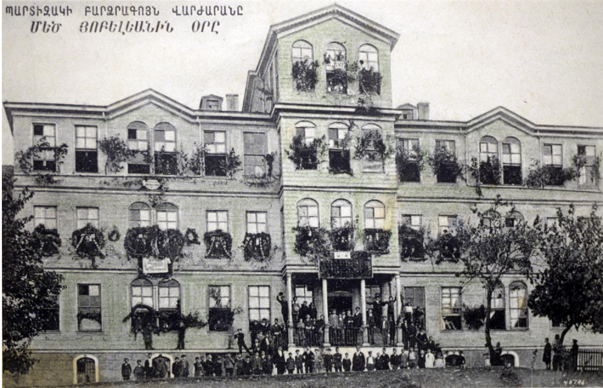
Bithynia High School, Bardizag.

ՊԱՐՏԻԶԱԿԻ ԲԱՐՁՐԱԳՈՅՆ ՎԱՐԺԱՐԱՆԸ ՄԵԾ ՅՈՒՆԵԼԵԱՆԻՆ ՕՐԸ