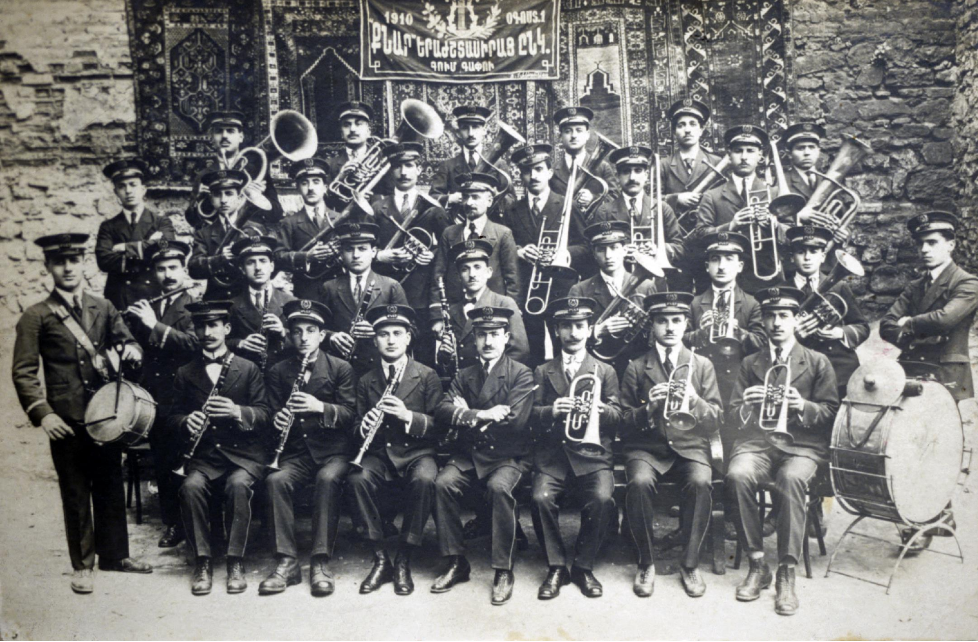
Bibliothèque Nubar de l'UGAB, Paris