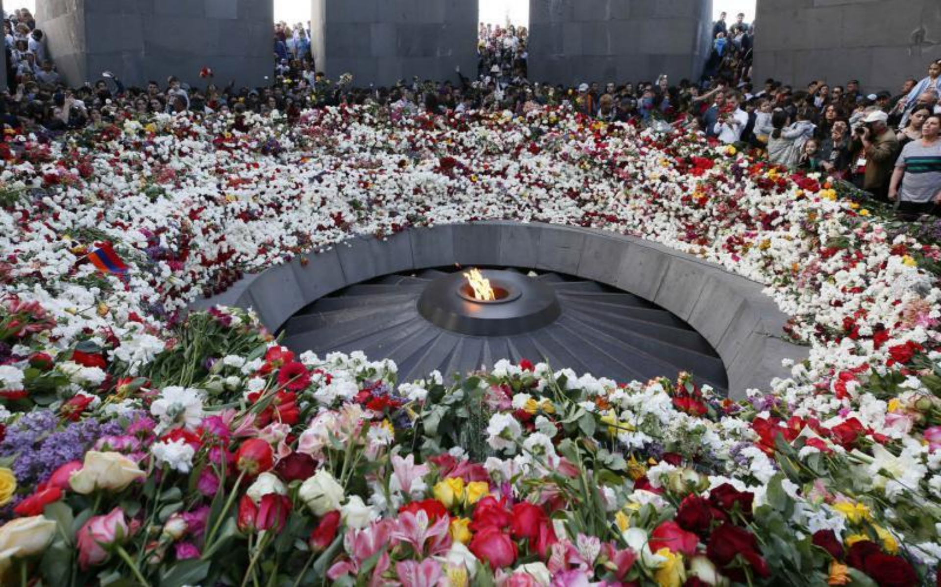
Dzidzernagapert (Colline des Hirondelles) Mémorial du génocide (24 avril 2018, Erevan)