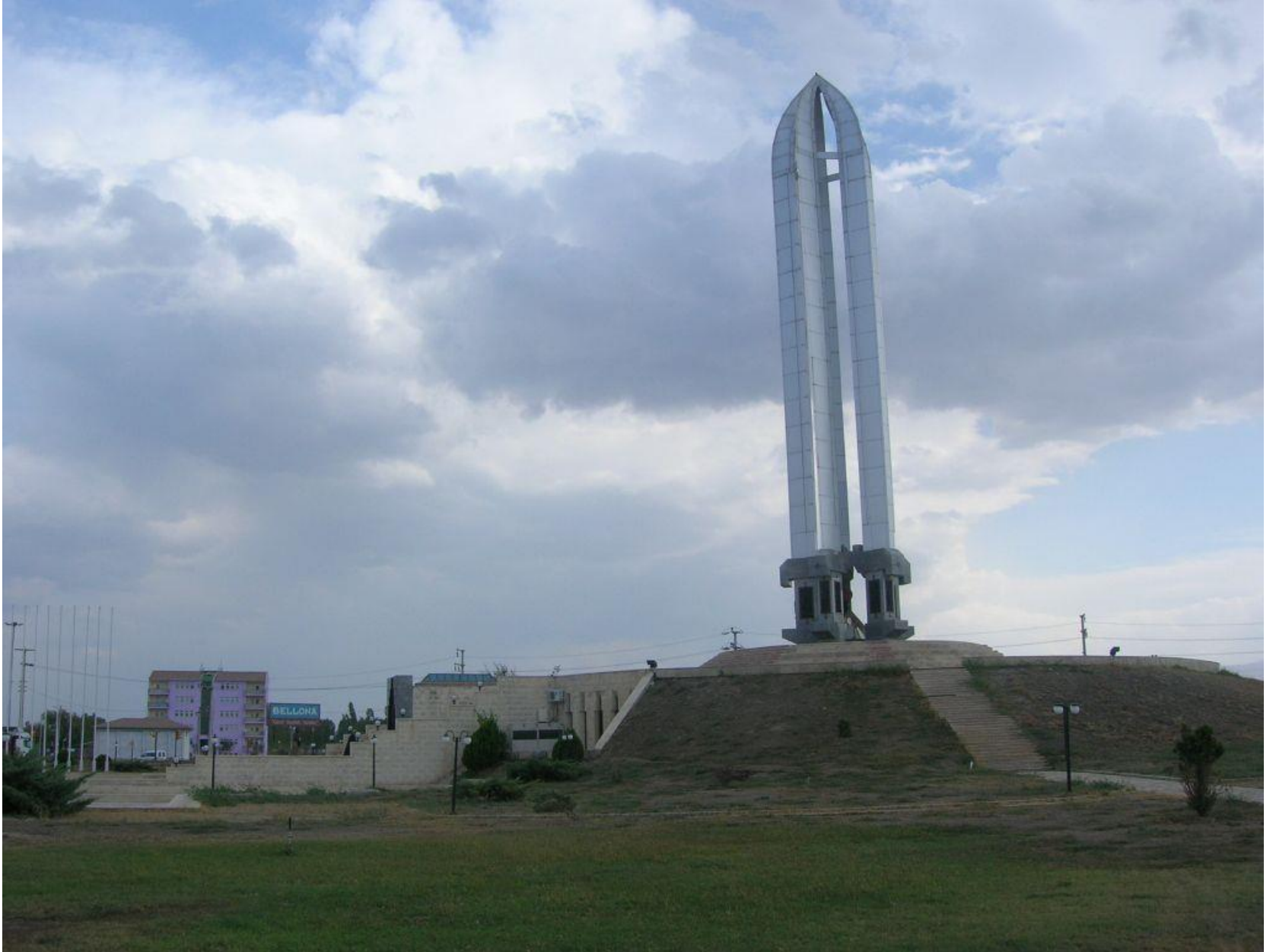
Ermeniler Tarafından Katledilen Şehit Türkler Anıt ve Müzesi Mémorial et Musée des Turcs martyrs massacrés par les Arméniens (İğdir, Turquie, érigé en 1997-1999)