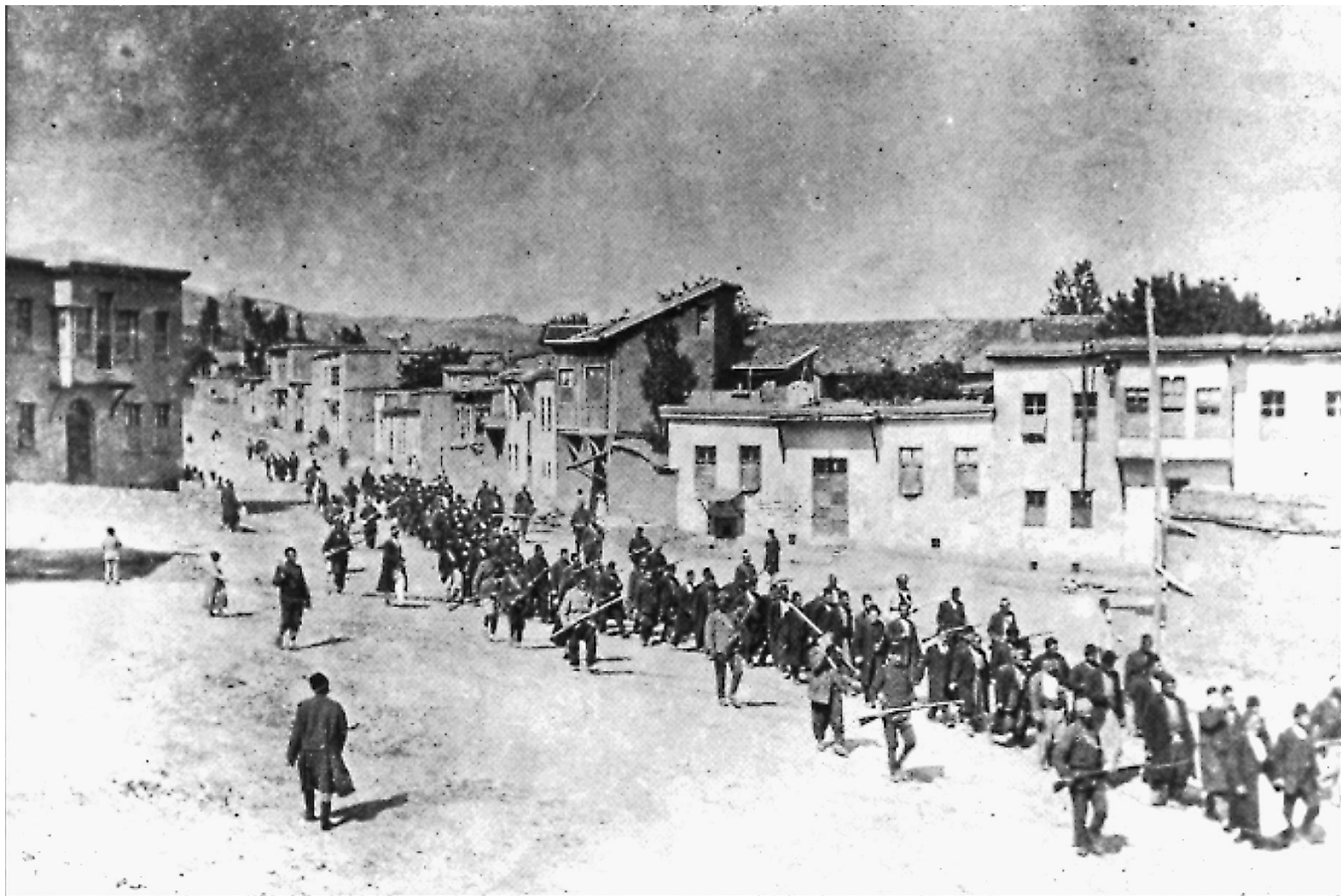
Convoi d'hommes arméniens emmenés par les gendarmes, Kharpert, 1915