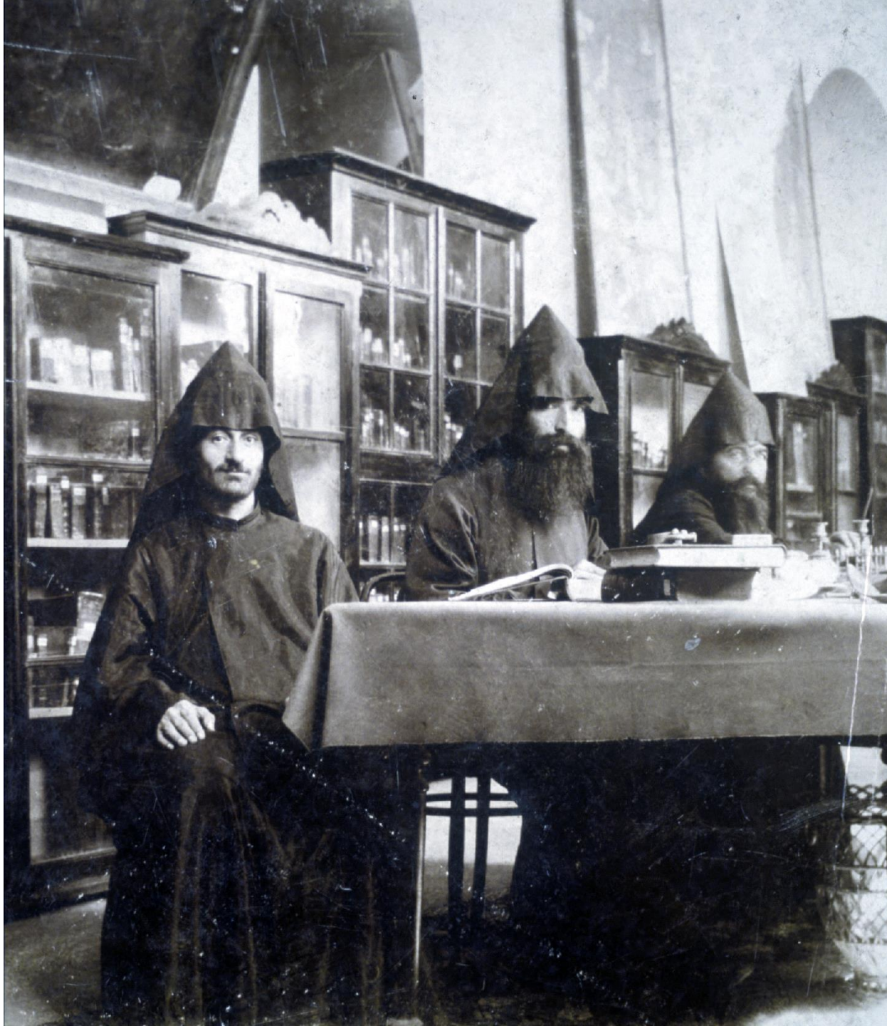
Bibliothèque Nubar de l'UGAB, Paris