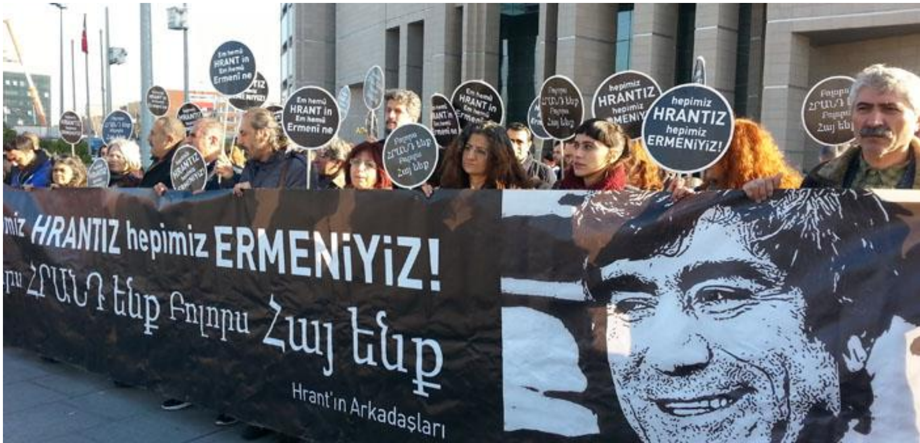
Manifestation à Istanbul en 2016 lors du procès des assassins de Hrant Dink , fondateur du journal Agos