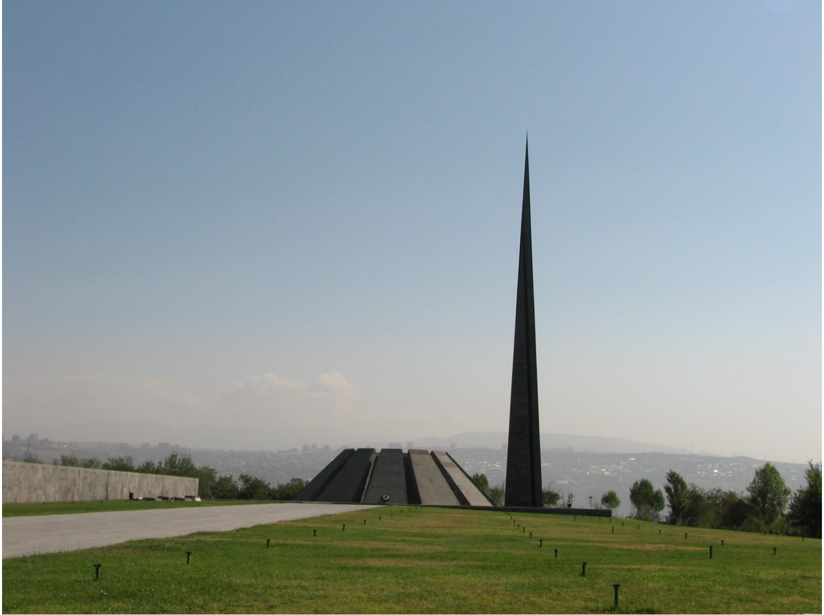
Dzidzernagapert (Colline des Hirondelles) Mémorial du génocide (Erevan, Arménie, inauguré en 1968)