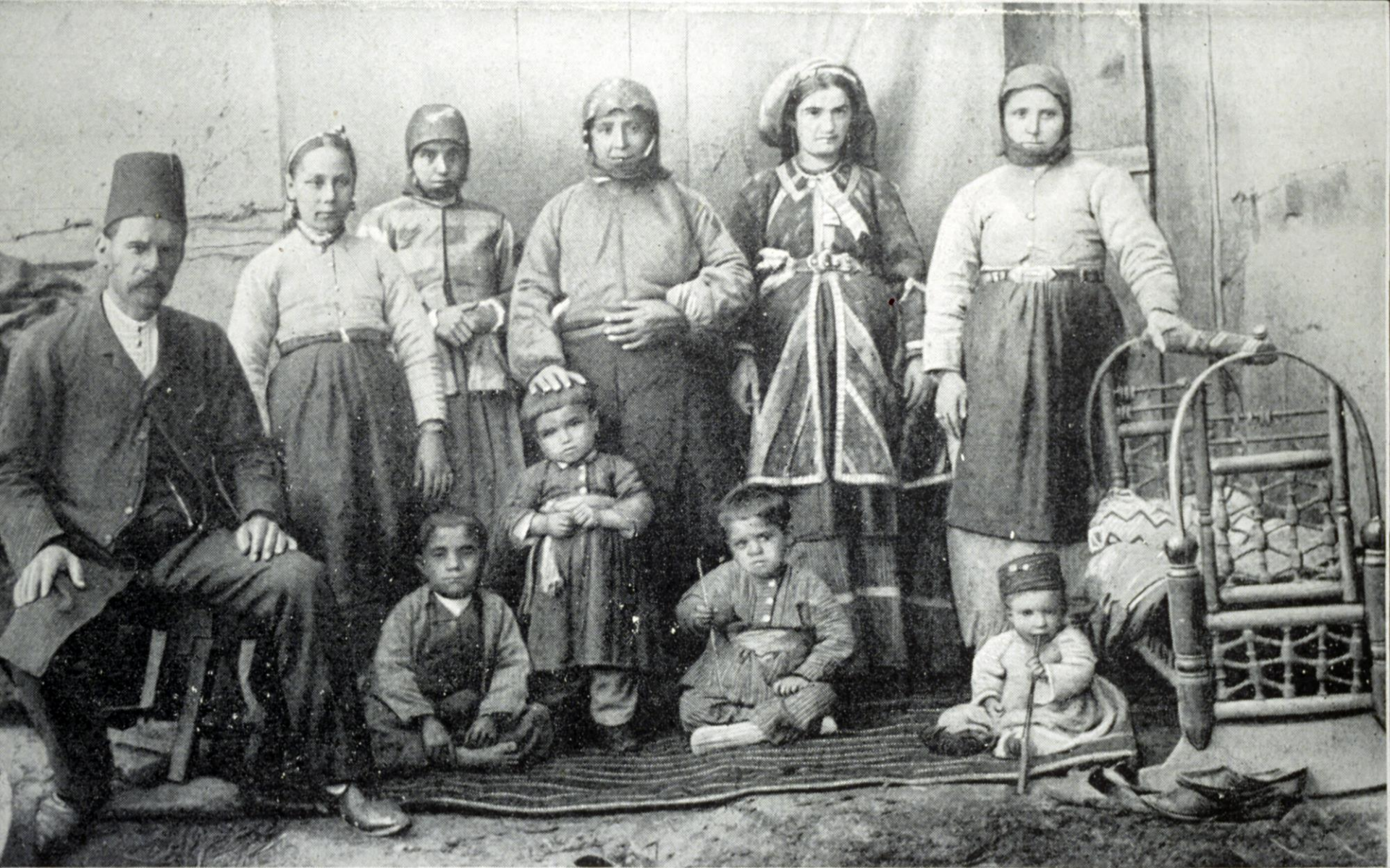
Bibliothèque Nubar de l'UGAB, Paris