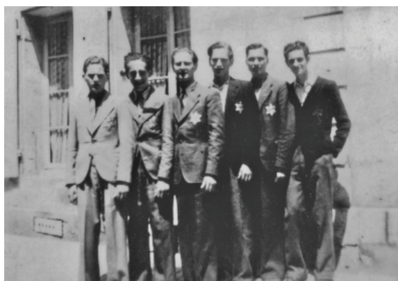
Lycéens juifs à Niort