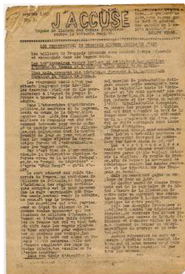
Avec cette feuille clandestine, le Mouvement National contre le Racisme mobilise l'opinion publique pour que se développe l'action des réseaux de sauvetage – octobre 1942

« Pour un enfant, au Noirvault, c'était la liberté. Je me promenais. J'accompagnais les vaches dans les champs. Le matin, c'était de grandes tartines de beurre salé. J'étais aimé par tout le village. »