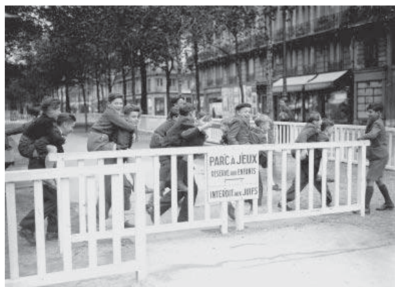
La 9 e ordonnance allemande interdit aux Juifs de fréquenter les lieux publics. Ici, à Paris, parc à jeux interdit aux Juifs – Novembre 1942

Les mesures d'exclusion se radicalisent jusqu'au printemps 1942 privant les Juifs des droits les plus élémentaires, les excluant de la vie économique et leur confisquant leurs biens privés. Le 2 nd statut juif promulgué par le régime de Vichy le 2 juin 1941 renforce l'exclusion économique. Désormais, les chefs de famille sont totalement exclus de la vie économique et mis au ban de la société. Pour assurer la subsistance quotidienne, le recours au travail clandestin et aux œuvres de bienfaisance juive est le lot commun. La 8 e ordonnance allemande du 29 mai 1942 impose en zone occupée le port de l'étoile jaune pour toute personne juive âgée de plus de 6 ans. La propagande antisémite désigne les Juifs ennemis de la société.