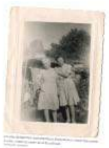
Quand le régime de la collaboration fut instauré, tous les Juifs furent considérés comme des ennemis de l'État. Ils furent donc envoyés dans les camps de concentration.

Les Juifs ont été sauvés de différentes manières. Certains ont été cachés par des Français, d'autres ont été envoyés dans des pays étrangers, d'autres encore ont été envoyés dans des camps de concentration.