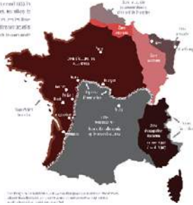
Carte de la France montrant la région de Poitou en rouge.

La Seconde Guerre mondiale a entraîné la déportation de centaines de milliers de Juifs français. Certains ont été cachés dans des familles d'accueil, d'autres dans des lieux souterrains, d'autres encore ont réussi à fuir le pays. Les familles d'accueil ont joué un rôle crucial dans la survie de ces personnes pendant la Seconde Guerre mondiale. Elles leur ont caché, les ont fait passer pour des amis, des voisins, des collègues de travail, etc. Elles leur ont fourni des faux papiers, des vêtements, de la nourriture, etc. Elles leur ont permis de se cacher dans des caves, des greniers, des sous-sols, etc. Elles leur ont permis de fuir les camps de concentration et de se rendre en France libre, en Angleterre, en Amérique, etc.