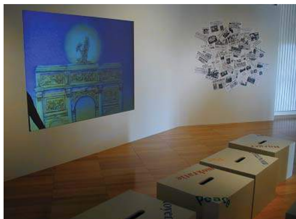
Exposition permanente Centre Régional « Résistance & Liberté »

Comprendre la construction et la finalité d'un film de propagande antisémite au service de l'idéologie nazie à partir des extraits du film Le Péril Juif .