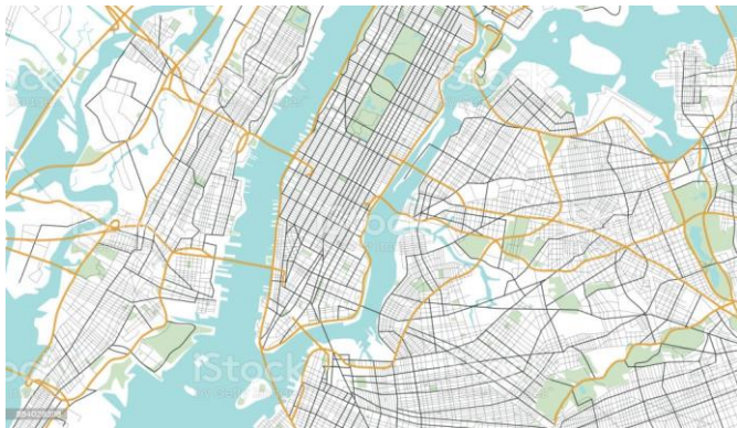
Plan de la ville de New York