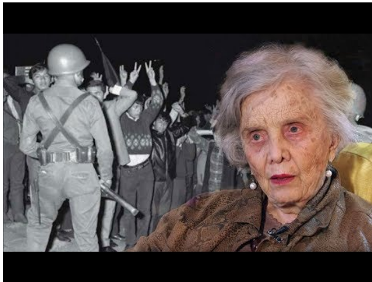
La noche de Tlatelolco narrada por Poniatowska (Video Youtube)