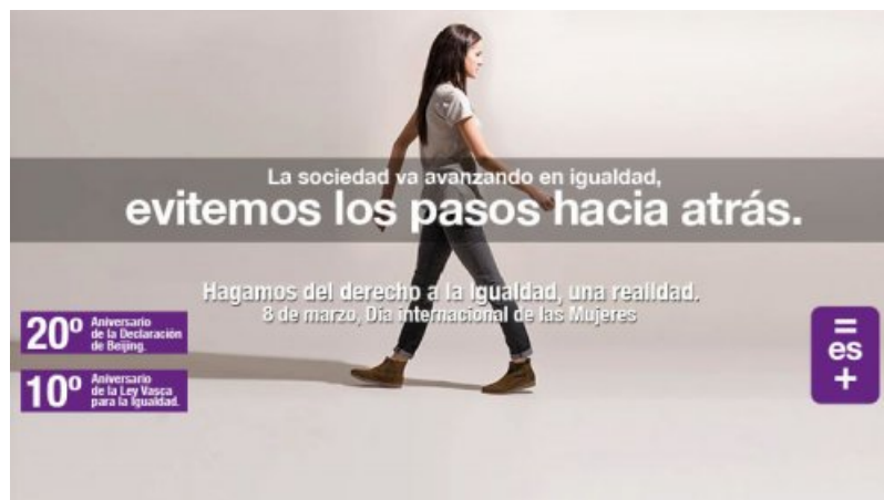
Affiche de 2015 sur la journée internationale des droits des femmes