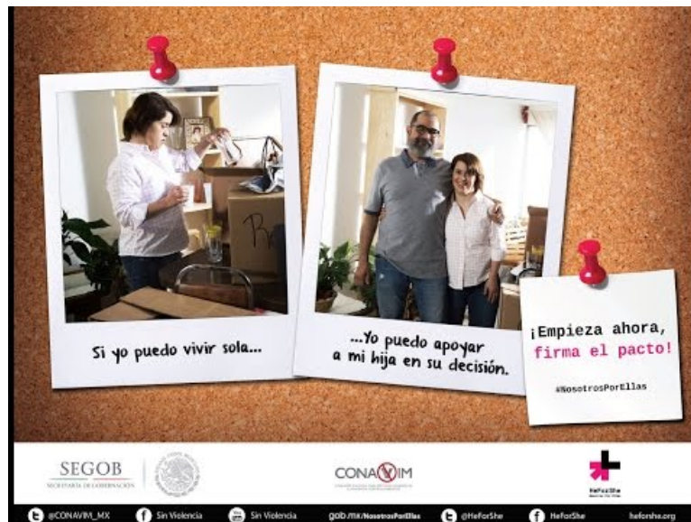
Nosotros por ellas (Video Youtube)

Vidéo du site Youtube, campagne de sensibilisation pour l'égalité des genres, réalisée par le gouvernement mexicain.