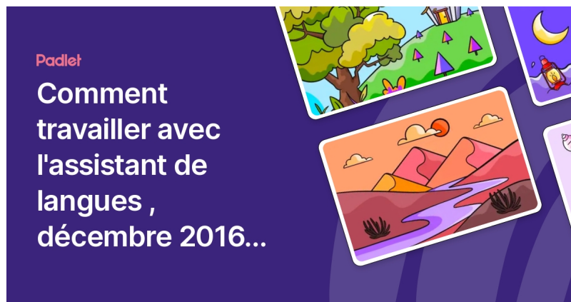
Comment travailler avec l'assistant de langues , décembre 2016, stage PAF ( Padlet )