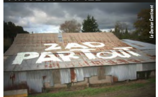
Le Dernier Continent