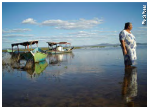
Rio de Vozes