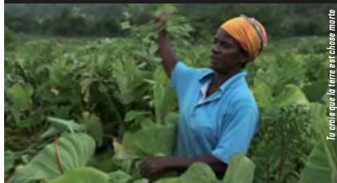
Tu crois que la terre est chose morte

TAP Castille Tarif: 5,5 € la séance / Le Joker 3 €