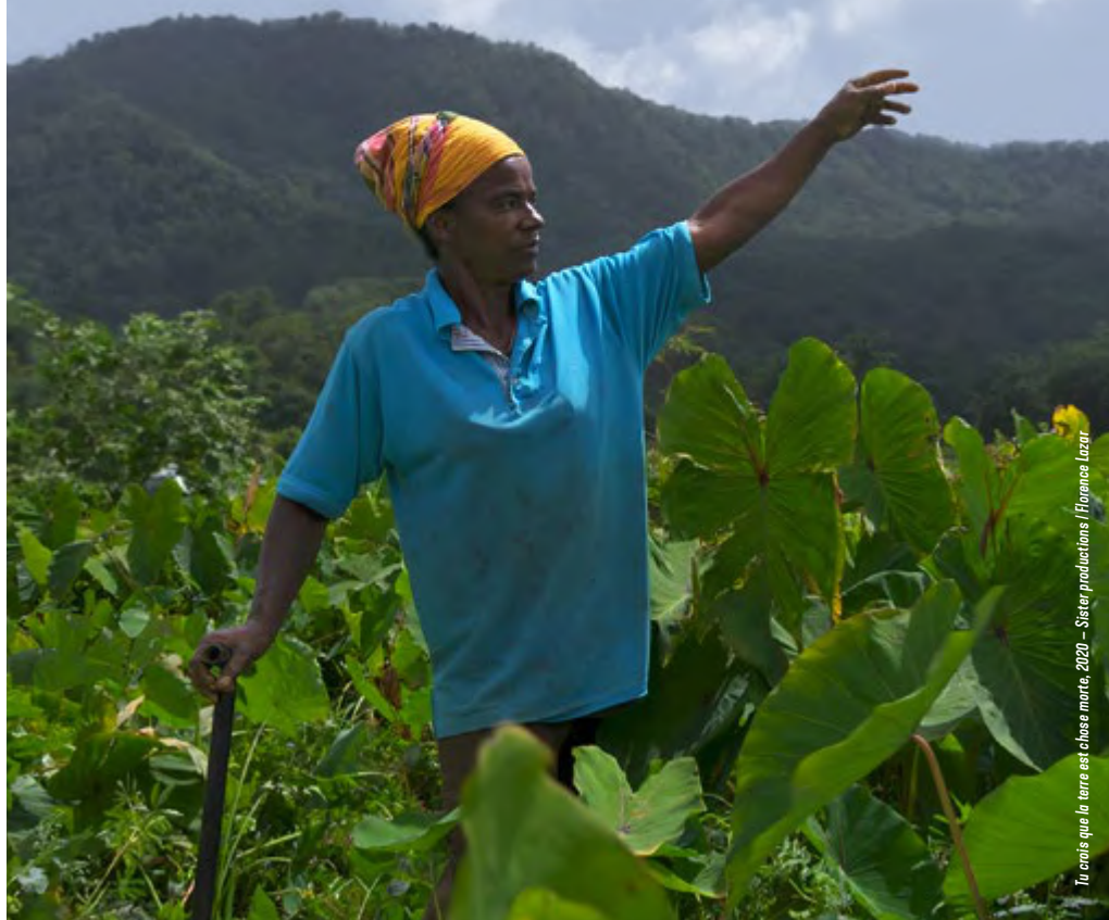
Tu crois que la terre est chose morte, 2020 - Sister productions / Florence Lazar