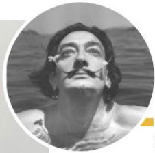
Salvador Dalí (1904-1989), artista español

“No entiendo por qué, cuando pido una langosta a la parrilla en un restaurante, nunca me han servido un teléfono cocinado.”