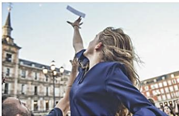
Plaza Mayor, Madrid.

La Plaza Mayor será testigo del octavo bombardeo de poemas de Casagrande, un grupo de cuatro poetas multidisciplinares y con clara vocación performativa. [...]