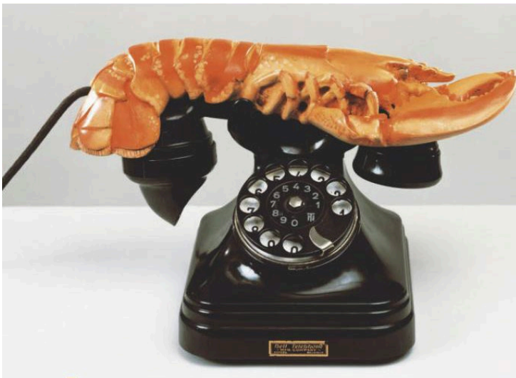
Salvador Dalí (artista español), Teléfono langosta , 1936.