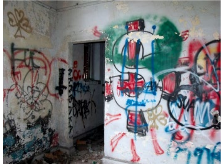
Grafitis en una casa en ruinas