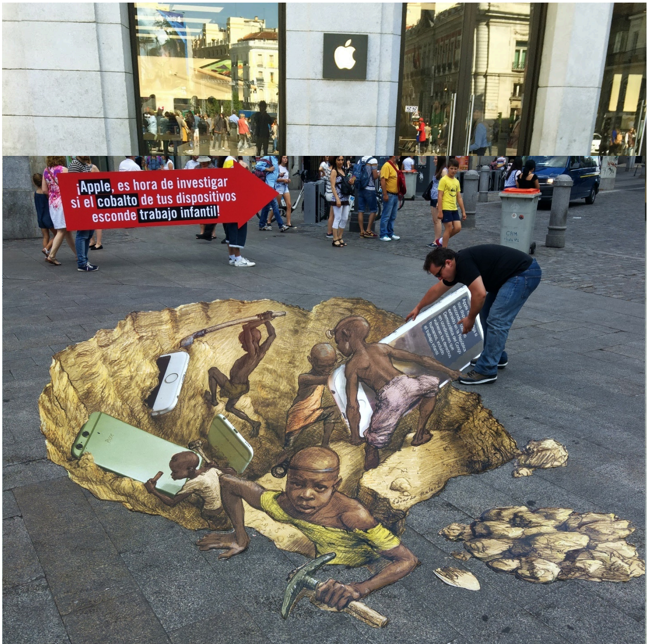
Niños mineros en vísperas del día mundial contra el trabajo infantil, Eduardo Relero, 11/06/2016, Madrid, España