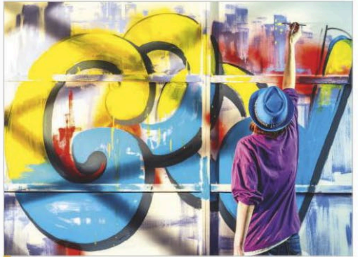
Un chico haciendo un grafiti.

2 A2 ¿Quién es el chico de la foto? ¿Está decorando o ensuciando el muro?