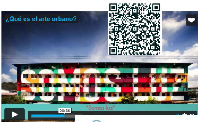
¿Qué es el arte urbano? © Líneas cruzadas, 2016.