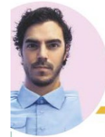
Paul Fuentes, Folded Fuentes , 2015.

“Quiero hacer feliz a la gente. Con un gato-sushi o una hamburguesa jugosa, mi objetivo es romper tu aburrido muro de Instagram y plasmar una sonrisa en tu cara.”