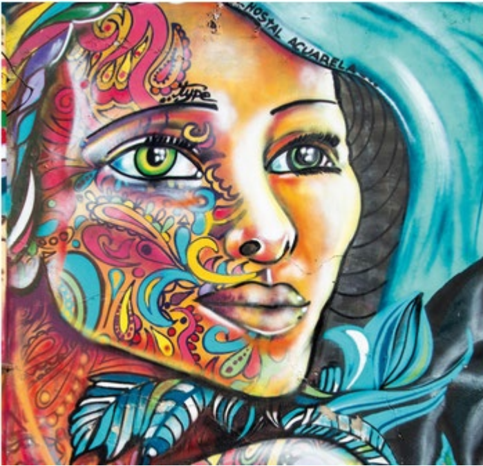
Mural anónimo en la ciudad chilena de Valparaíso