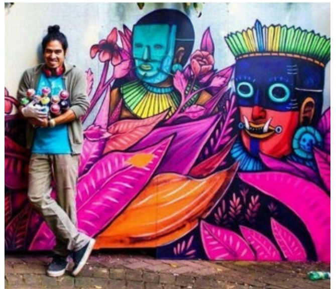
Mural del artista callejero mexicano Saner