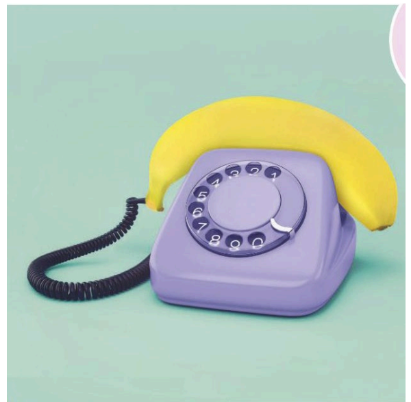
Paul Fuentes (artista mexicano), Hello Banana , 2015.