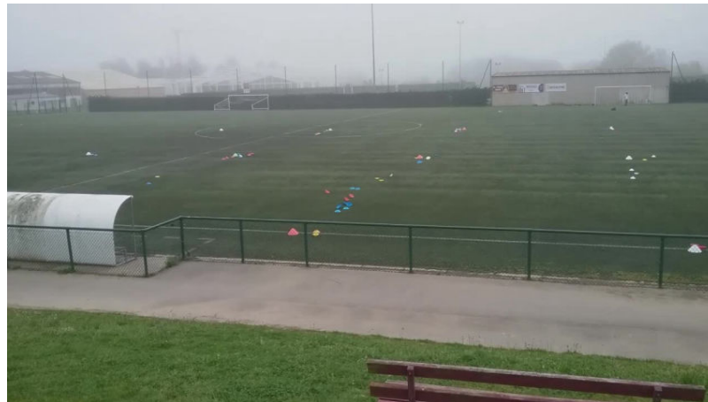
Situation de Pose dépose (Vidéo PeerTube)

Comme il l'a été évoqué dans la vidéo, le projet de l'élève n'est pas évalué. Il peut changer l'ordre des zones, il peut même s'adapter et changer les zones anticipées si l'exercice devient trop difficile ou trop facile. Quand il entrera les zones réellement atteintes, le fichier adaptera les % de VMA courus.