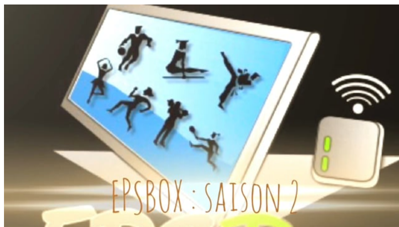
Nouvelles fonctionnalités de l'EPSBOX (Video Vimeo)

Article du Café pédagogique daté du 6 décembre 2018 ↗