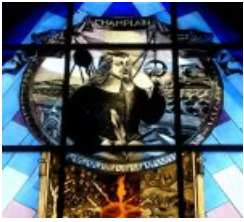
Champlain en route pour la Nouvelle-France

Pour finir, un travail plus précis peut-être développé à partir de l'exposition sur la conquête de la Nouvelle-France ou des vitraux dans l'église de Brouage, sans oublier la stèle de Champlain.