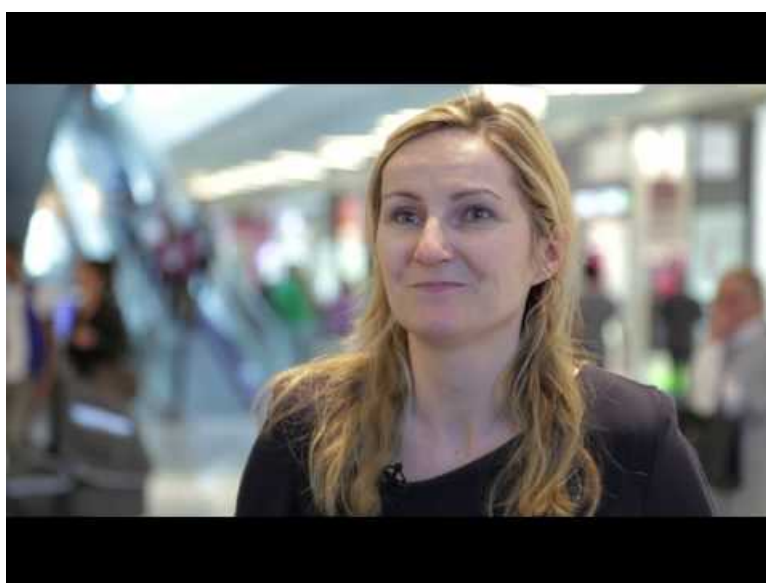
Centre Commercial Quartz- le centre connecté (Video Youtube) Le centre connecté en région parisienne Quartz

Quatre exemples de bonnes pratiques en matière de digitalisation des points de vente.